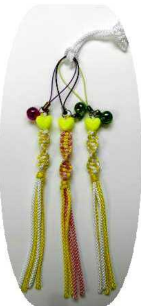
今回製作するアクセサリ